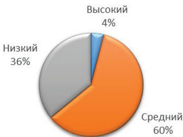
Рис. 1. Уровень экспортного потенциала предприятий Вологодской области, %

Тем не менее руководители экспортно ориентированных малых и средних предприятий отмечают, что возможность для повышения экспортного потенциала у их организаций есть. Однако для её