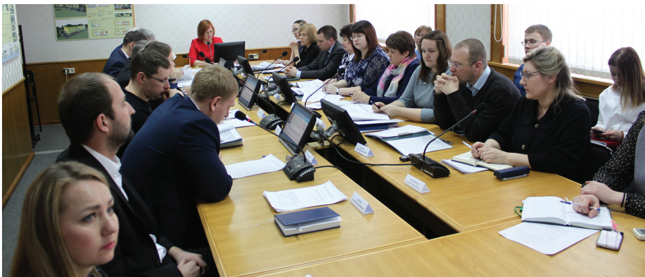
Заседание ученого совета ФГБУН ВолНЦ РАН 04.04.2018